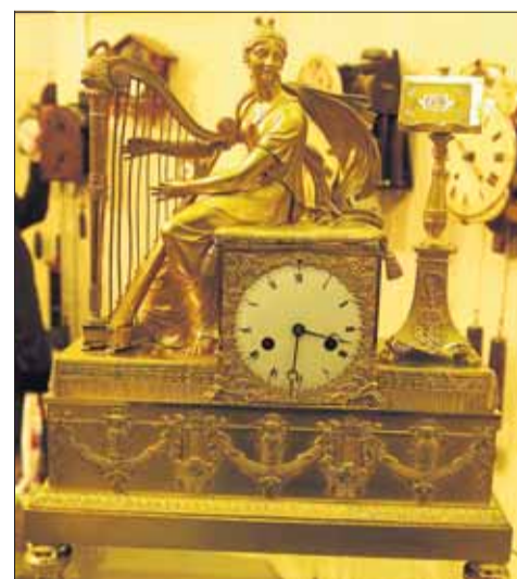
Manches Flohmarktschnäppchen mag in Wahrheit eine teure Antiquität sein