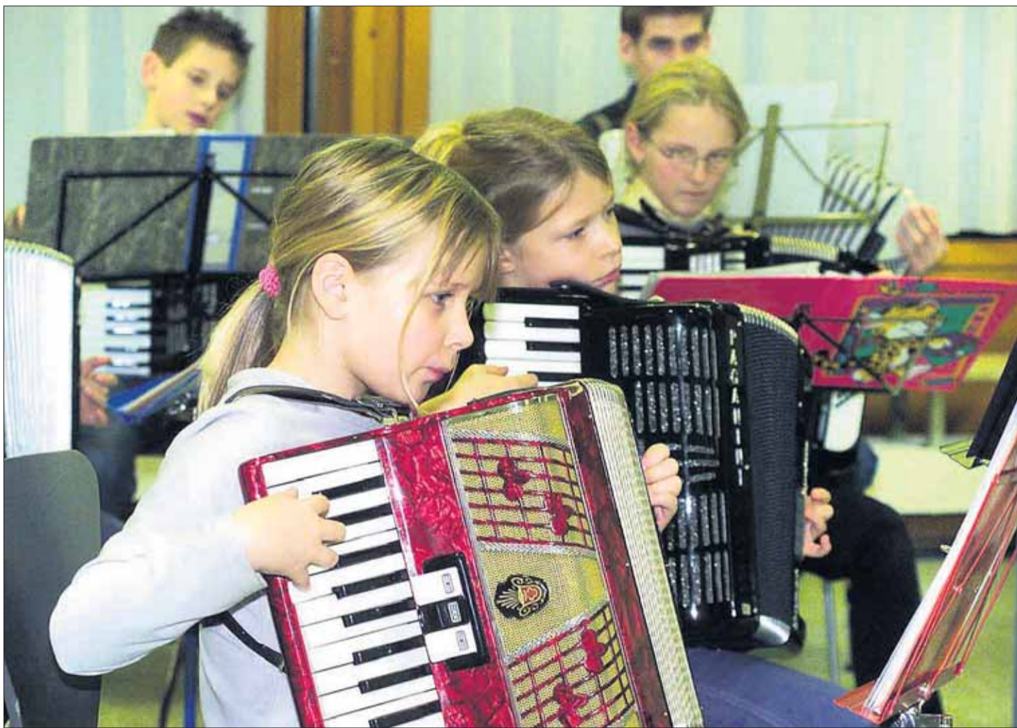
Akkordeon spielen will gelernt sein: Der HSB macht dafür viele Angebote